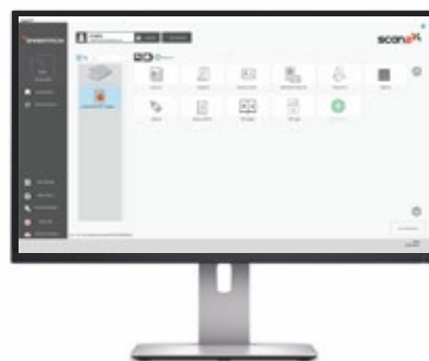
Scan2x en Windows