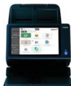
Scan2x en ScanFront