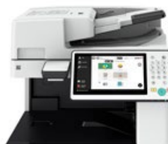
Scan2x en imageRUNNER